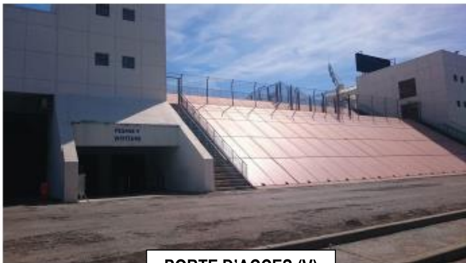
PORTE D'ACCES (V)