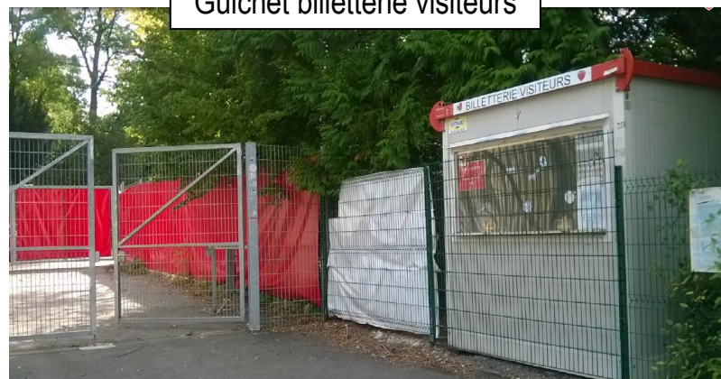
Guichet billetterie visiteurs