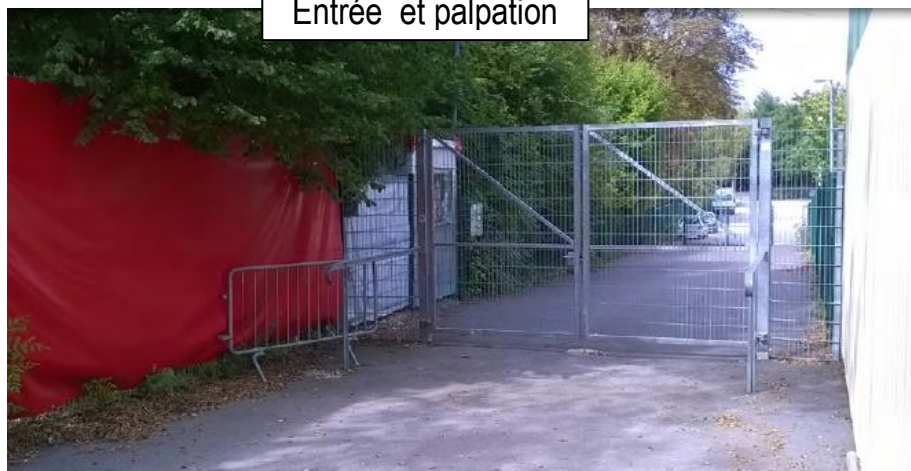
Entrée et palpation